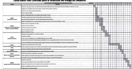
Carta Gantt Plan Comunal para la reducción del Riesgo de Desastres